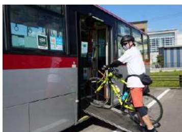
写真上右：函館バス

また、同協議会は函館駅近くにある男爵倶楽部ホテル&リゾート様からサイクリスト受入施設へのアドバイザリーを行なった他、ホテル発着のサイクリングツアーの可能性も模索しています。同様の取り組みは茨城県土浦市のホテルにおいても行われており、JCTA会員が地域企業の自転車施策に関わっています。