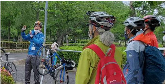
写真下2点：ガイド養成講座@土浦&東京