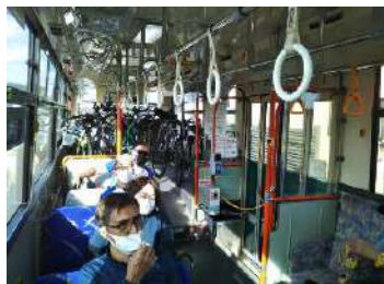
写真左上：実証実験中のいさりび鉄道車内