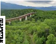
三国峠からの景観