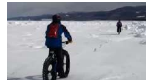
流水ライド:斜里海岸