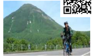
知床峠ダウンヒル