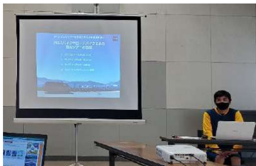
写真上：ルート造成講座の様子@倶知安

JCTA会員がサイクルツーリズムに関わるものとして、自らの立ち位置とその責務を明確にする行動指針を策定しました。