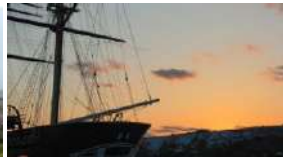
開陽丸・かもめ島