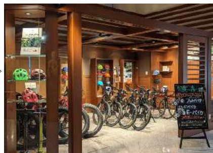
地域の自転車施策をリードするくしろロコサイクルプロジェクト