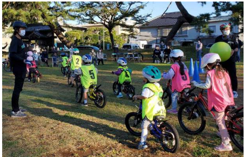
写真右：自転車教室@土浦

自転車教室は新型コロナと東京五輪の影響で、10月からスタートしました。東京都千代田区の皇居パレスサイドと茨城県土浦市で計6回、子供たちと楽しい時間を過ごすことができました。教室開催も3年目を迎え、認知も広がったため、キャンセル待ちやリピーターの方も増えてきました。