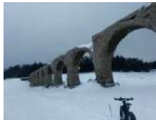
糠平湖・冬の氷上ライド トウシュベツ川橋梁

多くのサブルートも開発され糠平湖、三国峠から太平洋までの広いエリアでルートとアクティビティが開発されています。