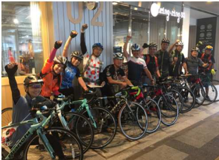
太宰治縁の地、五所川原市では、津軽鉄道のサイクルトレインを 実習に取り入れました 青森県五所川原市 9/29-30 (写真中)