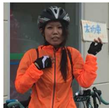
走行上の注意事項を軽妙な語り口とお手製 カードで説明 茨城土浦市 6/20-21 (写真上)