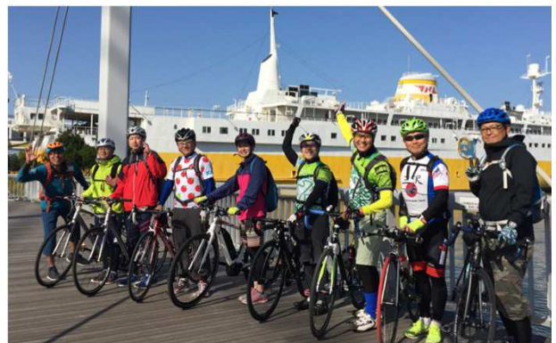
八甲田丸を背景に (写真下) 青森市 10/20-21