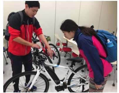
青森では初めて電動アシスト自転車を使ったガイドが誕生 (写真上)