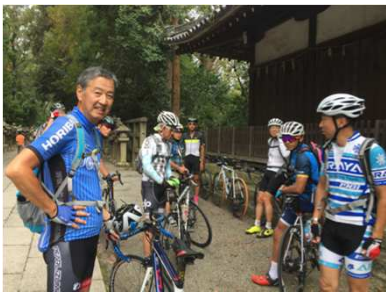
英語と日本語で 見どころ説明を！ @京都府八幡市 9/22-23 (写真左)