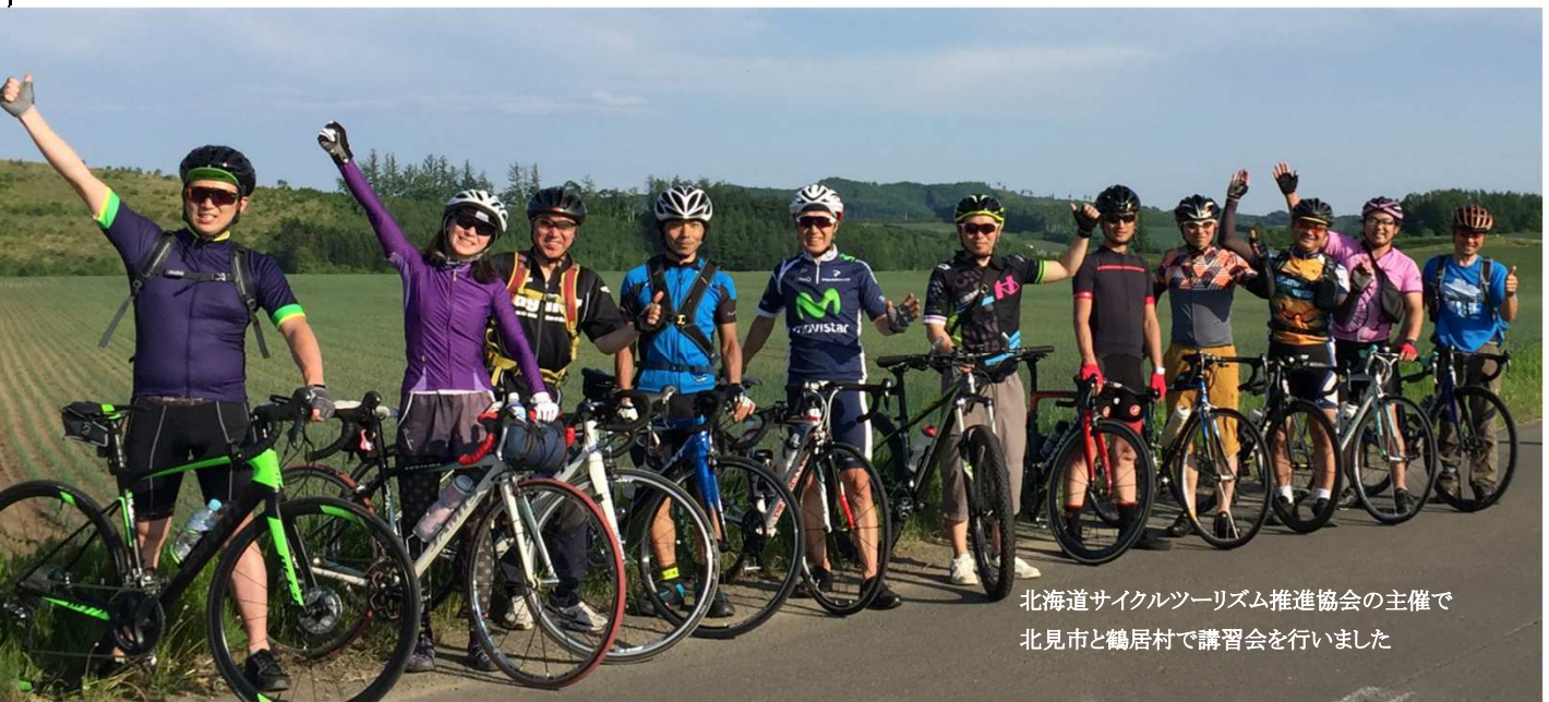
北海道サイクルツーリズム推進協会の主催で 北見市と鶴居村で講習会を行いました