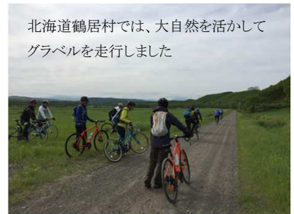
北海道鶴居村では、大自然を活かして グラベルを走行しました